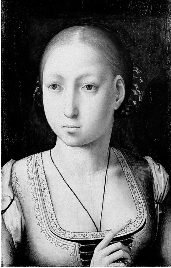
Johanna von Kastilien Gemälde von Juan de Flandes, um 1500

»In Spanien wird gerade erklärt, dass ich nicht mehr bei Sinnen bin.«